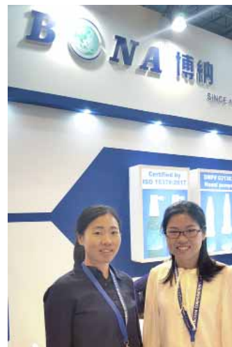
Е. Лу с коллегой «Bona Pharma», фото на выставке CPhI, Innpack 2018

Компания «БОНА Фарма» более 20 лет является лидером китайского рынка по решениям в области фармацевтической упаковки и систем доставки лекарств. Высочайшее качество продукции «БОНА Фарма» подтверждено Сертификатом ИСО 15378 (GMP). Основной продукцией компании являются насадки-распылители (спрееры) для лекарственных средств полимерные для назального, орального, вагинального и кожного применения и флаконы полимерные для лекарственных средств объемом от 5 мл до 250 мл.